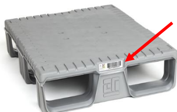
RFID- og strekkode etikett